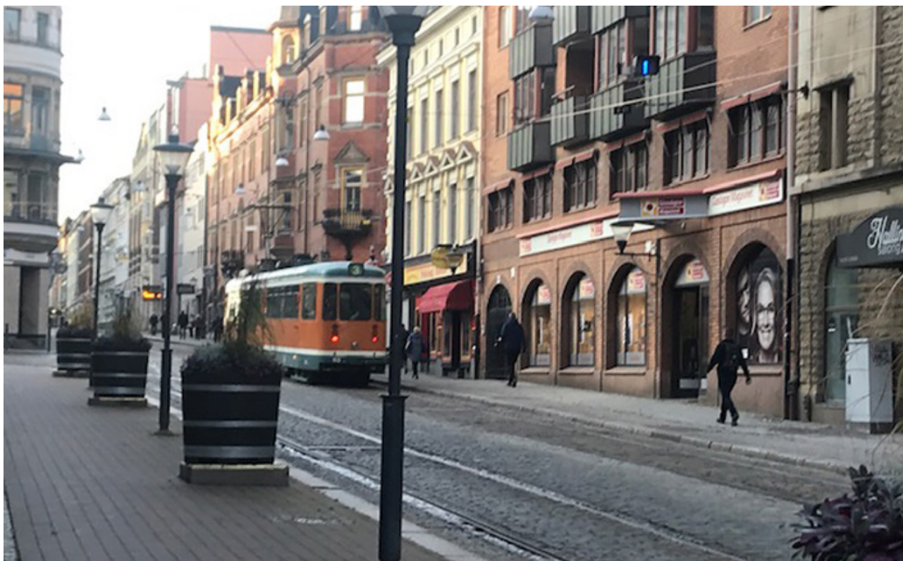
Drottninggatan med spårvagn.