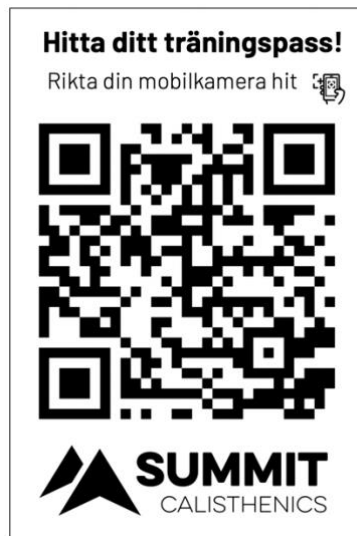
QR-Kod för direkt scanning i mobilen vid anläggningarna