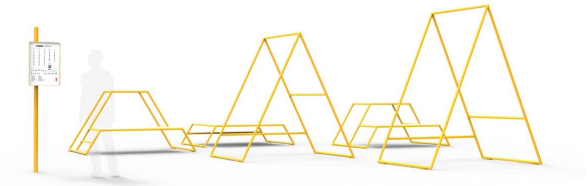
Tre valfria standardfärger Specialfärg är möjligt för tilläggskostnad